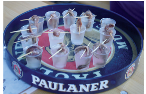
Fehlen durfte natürlich auch nicht der wohlschmeckende „Hängebauch“